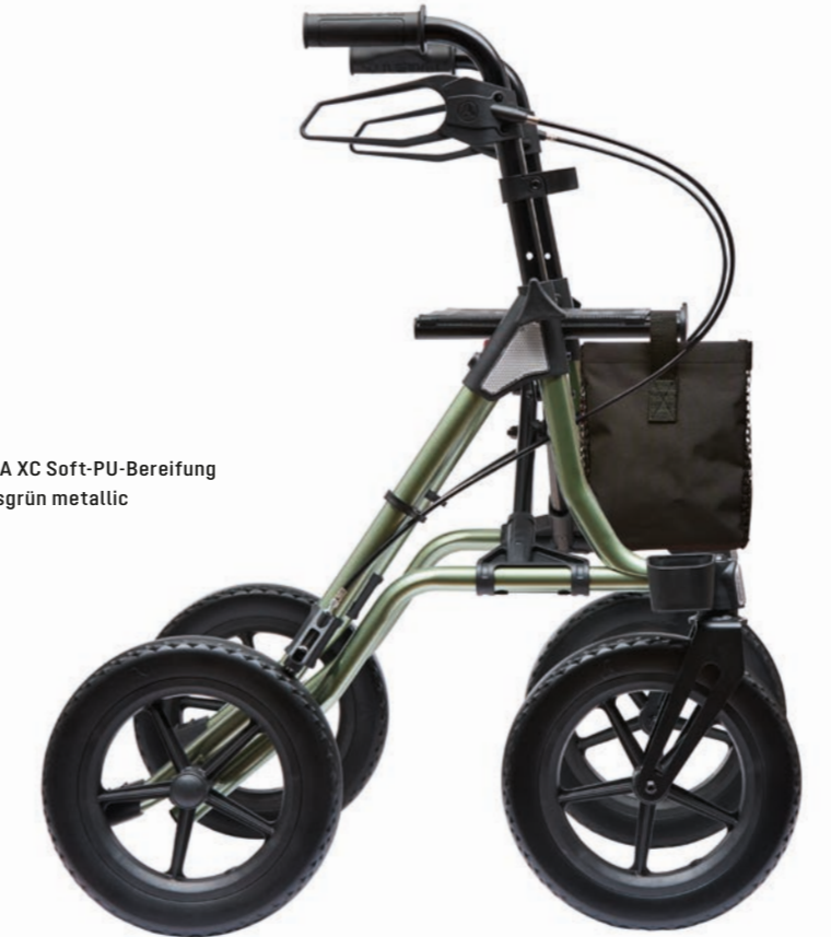
TAiMA XC Soft-PU-Bereifung Oasisgrün metallic

In die Radgabel integrierte Lenkungsdämpfer unterstützen den ruhigen Geradeauslauf der beiden Vorderräder.