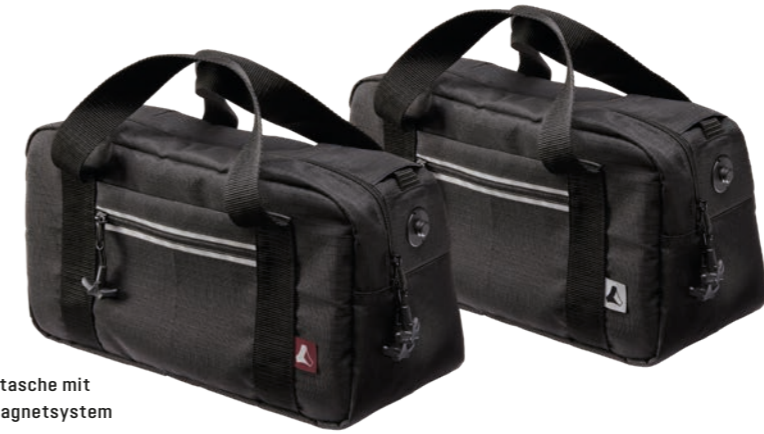
Premiumtasche mit Fitlock Magnetsystem