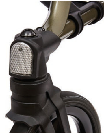
Rahmengröße M: Resedagrün metallic

Als führender Hersteller bietet die DIETZ GROUP Ihnen eine große Auswahl an hochwertigen Rollatoren. Es sind einfach zu bedienende, durchdachte Alltagshelfer für jeden Bedarf in ansprechender Optik und mit intelligenten Funktionen, die Ihnen Stabilität und sicheren Halt garantieren, wann immer es darauf ankommt. Mit nur 5,5 kg Gewicht und sinnvollen Ausstattungsmerkmalen ist der »TAiMA M-GT« wohl eines der erfolgreichsten Rollatormodelle der vergangenen Jahre.