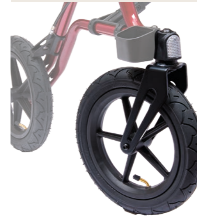
TAiMA XC Luftbereifung Rot metallic

Hochwertige Reflektoren an allen Seiten erhöhen die Sicherheit bei einsetzender Dunkelheit.