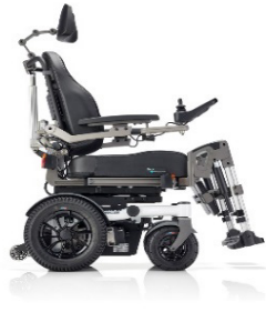
SANGO RWD Sitzmodul SEGO comfort