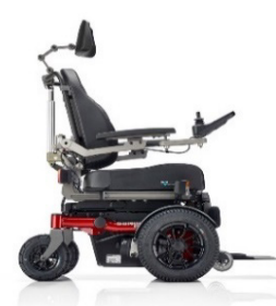
SANGO FWD Sitzmodul SEGO comfort