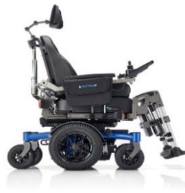
SANGO MWD Sitzmodul SEGO comfort