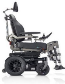
SANGO slimline RWD Sitzmodul SEGO Comfort