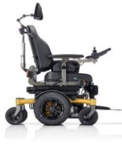
SANGO slimline MWD Sitzmodul SEGO Comfort HMV-Nr. 18.50.04.0210