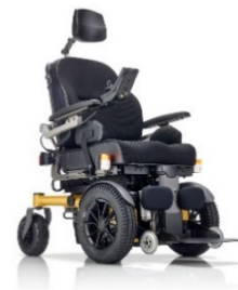
SANGO slimline FWD Sitzmodul SEGO Comfort