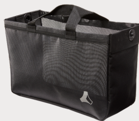
Sacoche standard noir