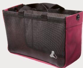
Sacoche standard amarena