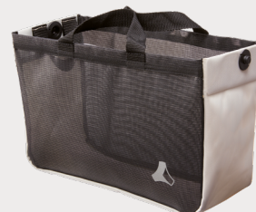
Sacoche standard cachemire