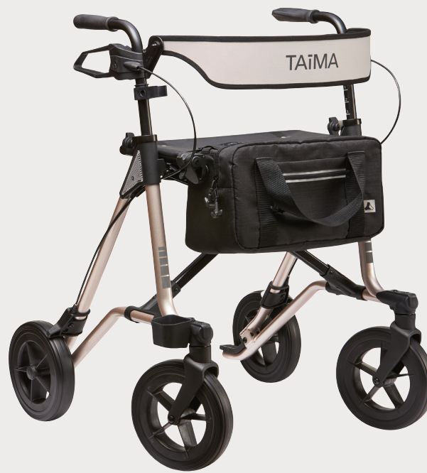
Sacoche premium, cachemire/noir