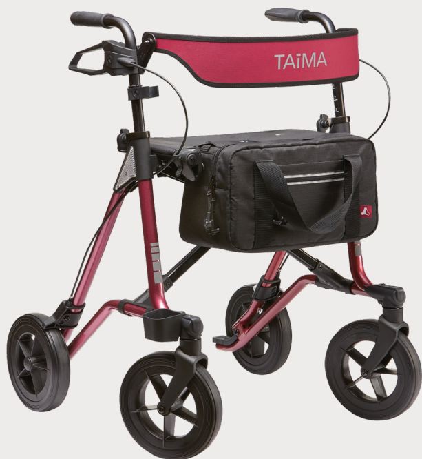
Sacoche premium, amarena/noir