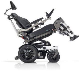
SANGO advanced RWD Sitzmodul SEGO comfort lift HMV-Nr. 18.99.06.1115