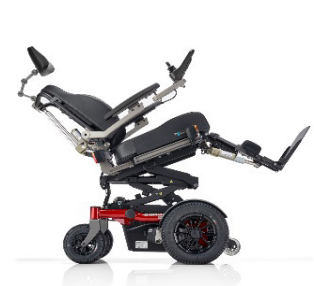
SANGO advanced FWD Sitzmodul SEGO comfort lift HMV-Nr. 18.99.06.1117