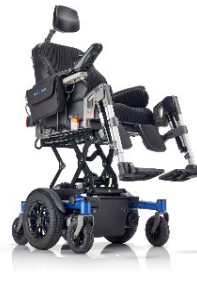
SANGO advanced MWD Sitzmodul SEGO comfort lift HMV-Nr. 18.99.06.1116