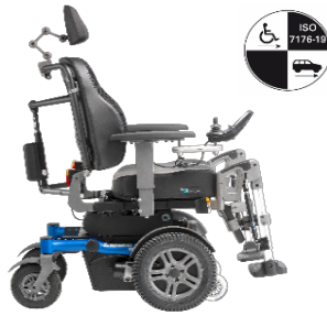
SANGO xx-large FWD Sitzmodul SEGO