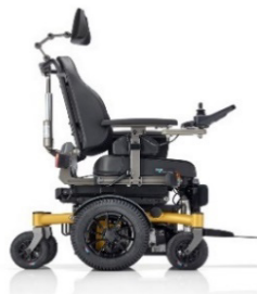
SANGO slimline MWD Sitzmodul SEGO comfort lift HMV-Nr. 18.99.06.1131