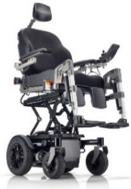
SANGO slimline RWD Sitzmodul SEGO comfort lift HMV-Nr. 18.99.06.1154