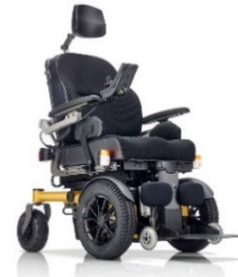
SANGO slimline FWD Sitzmodul SEGO comfort lift HMV-Nr. 18.99.06.1153