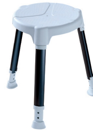
TAYO rund SilverLine

Kompaktes Maß, hochsicherer Stand: Der TAYO Duschhocker rund ist eine zuverlässige, stabile Unterstützung bei der täglichen Körperhygiene. Wahlweise mit Drehteller inklusive Softpad für noch mehr Komfort.