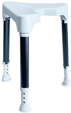
TAYO dreieckig SilverLine

Abgestimmt auf ergonomische Anforderungen vermittelt der TAYO Duschhocker mit Sattelsitz höchsten Komfort bei kompakten Maß. Der sowohl vorne und hinten einsetzbare Hygieneausschnitt erleichtert die tägliche Körperpflege.