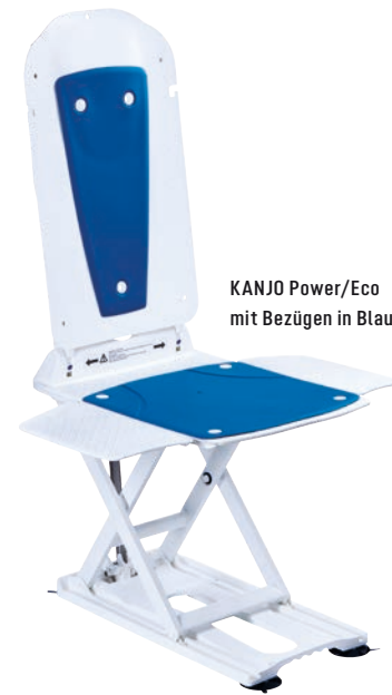
KANJO Power/Eco mit Bezügen in Blau