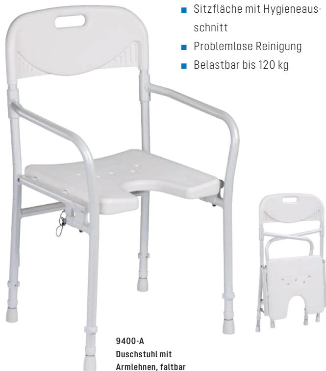
9400-A Duschstuhl mit Armlehnen, faltbar