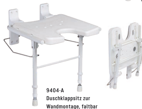
9404-A Duschklapsitz zur Wandmontage, faltbar