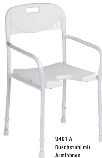
9401-A Duschstuhl mit Armlehnen