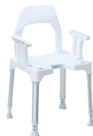
Stuhl mit Armlehnen