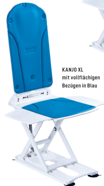
KANJO XL mit vollflächigen Bezügen in Blau