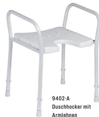
9402-A Duschhocker mit Armlehnen