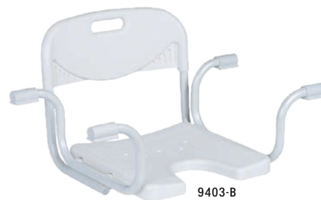
9403-B Mit Rückenlehne