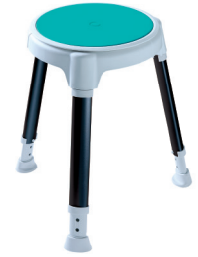
TAYO rund SilverLine inkl. Drehteller und Pad