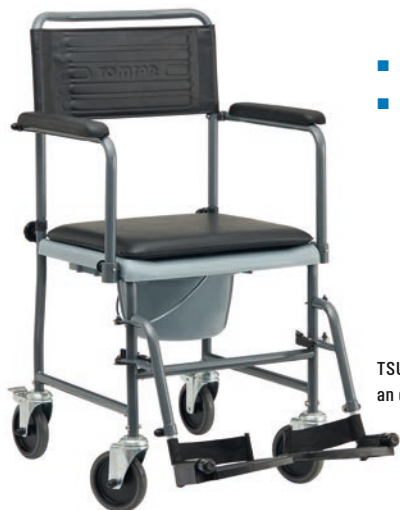
TSU-2, mit Feststellbremsen an den beiden Hinterrädern