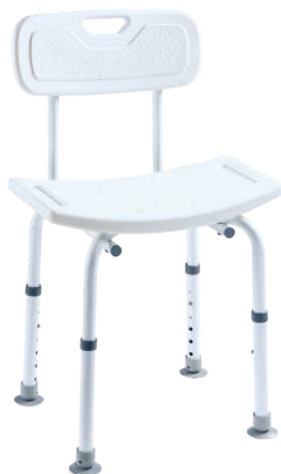
TOMTAR DS Duschstuhl, höhenverstellbar