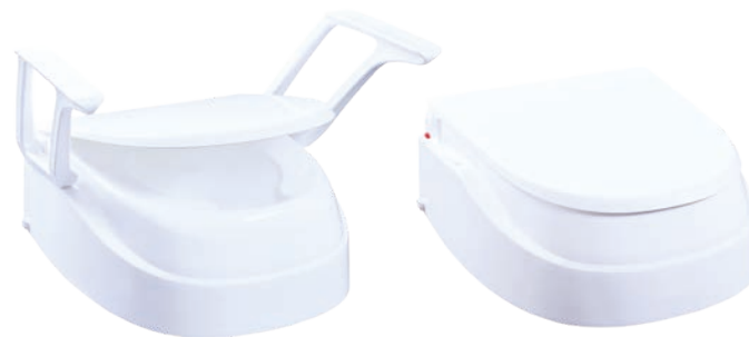
SmartFix mit Armlehnen