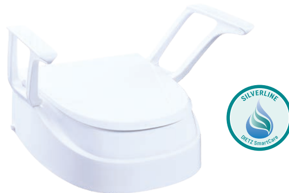
SmartFix SilverLine mit Armlehnen.