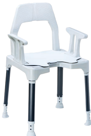
Stuhl mit Armlehnen und Sitzpad

Das Premium-Modell »TAYO SilverLine« bietet zusätzlich zur TAYO Serie folgende Vorteile: