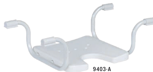
9403-A Ohne Rückenlehne

Ganz nach Ihrem Format: Ergonomische Badewannensitze mit Hygieneausschnitt zur Verringerung der Wannensitztiefe bieten Ihnen bequemes und sicheres Badevergnügen.