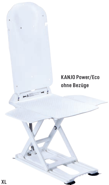
KANJO Power/Eco ohne Bezüge