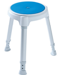
TAYO rund inkl. Drehteller und Pad