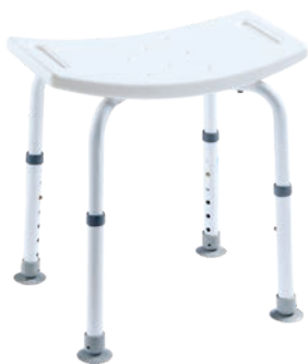
TOMTAR DH Duschhocker, höhenverstellbar