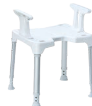
Hocker mit Armlehnen